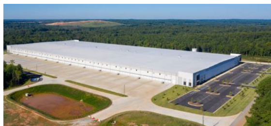
ジャクソン部品倉庫 外観