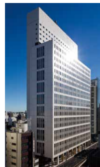
上野イーストタワー