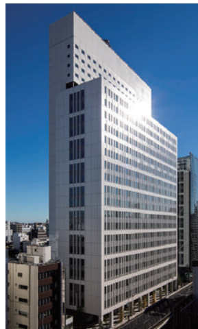
上野イーストタワー